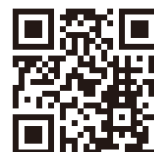
神奈川県病院協会 一般演題募集ページ